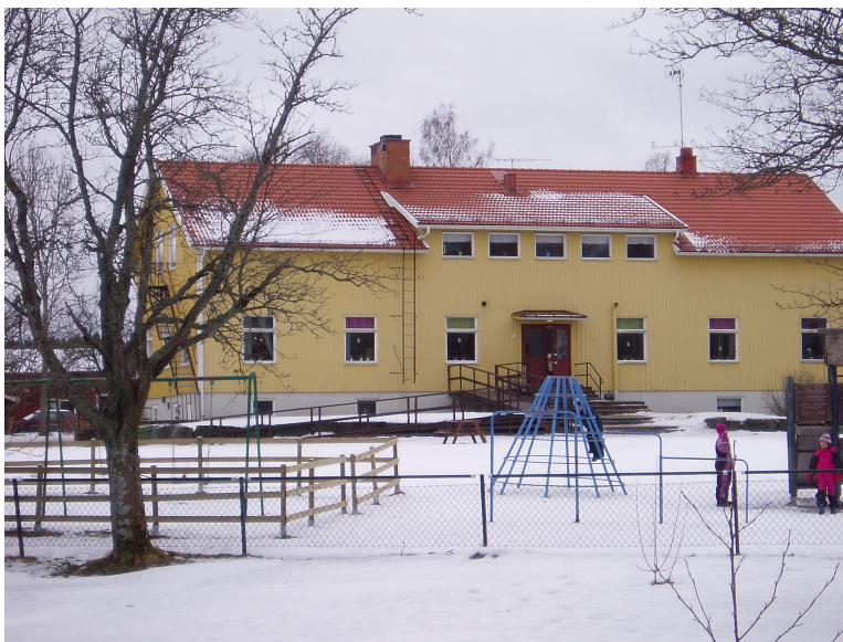
Grytnäs kyrkskola februari 2012

Jag och min klass måste ju naturligtvis gå till skolan även på lördagarna som man gjorde då. Hur skulle jag då ta mig dit? Genom bekantas bekanta fick jag kontakt med en lite äldre man som bodde i