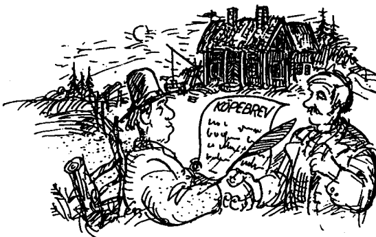
(Släktforska, Steg för steg)