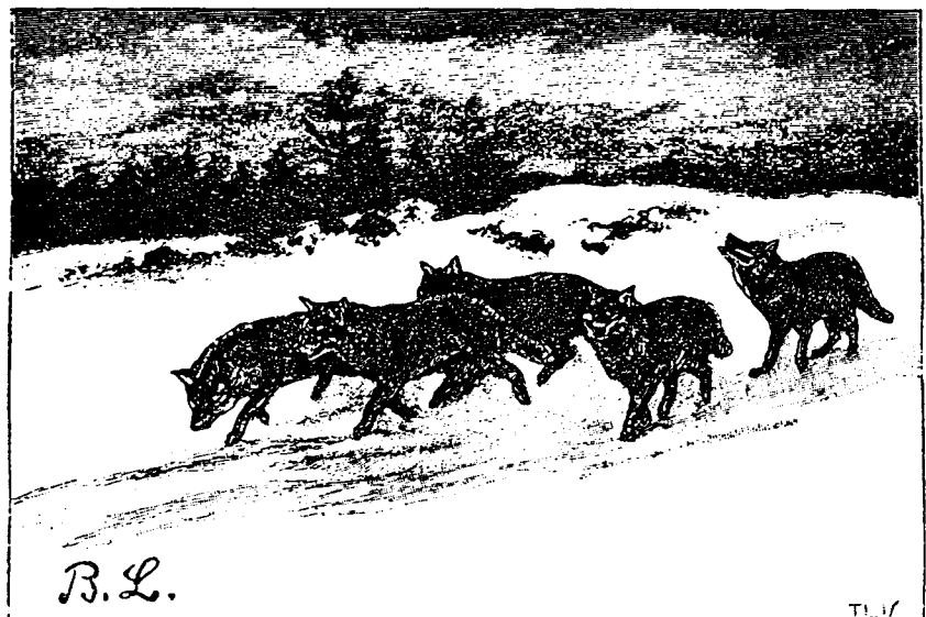
På julfattningen fick inga ljus brinna. Då fick vargen makt över gården ett helt år. Illustration efter Bruno Liljefors i Läsebok för folkskolan.

"Ät väl, trivs väl, lägg hulle på reva å ta mærgen i bena. Det är första julekväll i kväll."