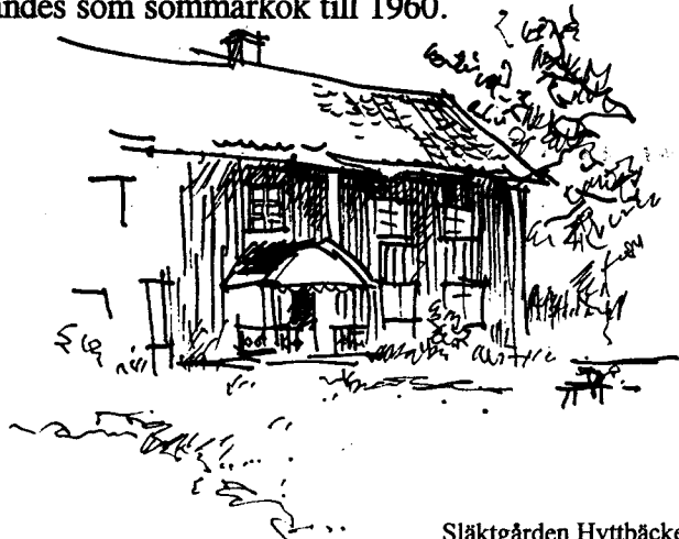
Kopia ur: Folkärna. En kortfattad orientering om dåtid och nutid

Det inledande citatet är hämtat ur Erik Axel Karlfeldts dikt Träslottet som beskriver hans mors barndomhem, släktgården i Hyttbäcken. Huset kallas fortfarande Träslottet efter den berömda dikten. Huset byggdes i slutet av 1700-talet efter en fruktansvärd brand där 20 byggnader, kreatur och gröda ödelades. 1810 byggdes övervåningen. Huset är rött med vita knutar och fönsterbräder. Exteriören är i stort sett densamma nu som när tillbyggnaden gjordes. Huset var bebott ända till 1914 och köket användes som sommarkök till 1960.